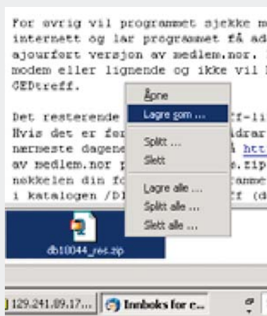
Figur 2: Lagre vedlegget

Det første du må gjøre er å laste ned ZIP-fila fra e-posten din. Hver e-postleser har sine menyvalg, men prinsippet er uansett det samme. Her er et eksempel fra e-postleseren Mozilla Thunderbird (se Fig. 1).