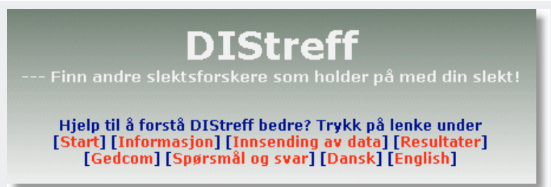
Figur 1: DIStreff menyvalg