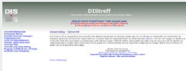
Figur 2: Her vises siden etter at du har valgt «Innsending»