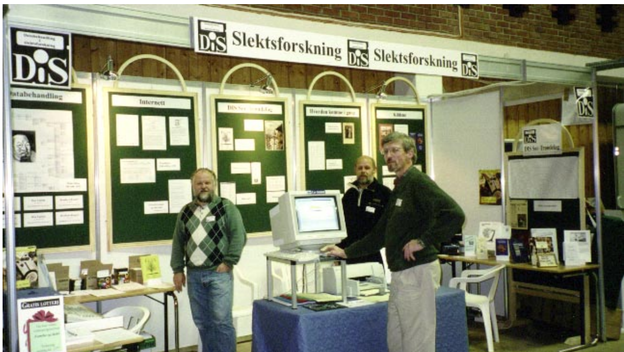
Fra vår stand på Trøndermessa 97 (30. oktober - 2. november)