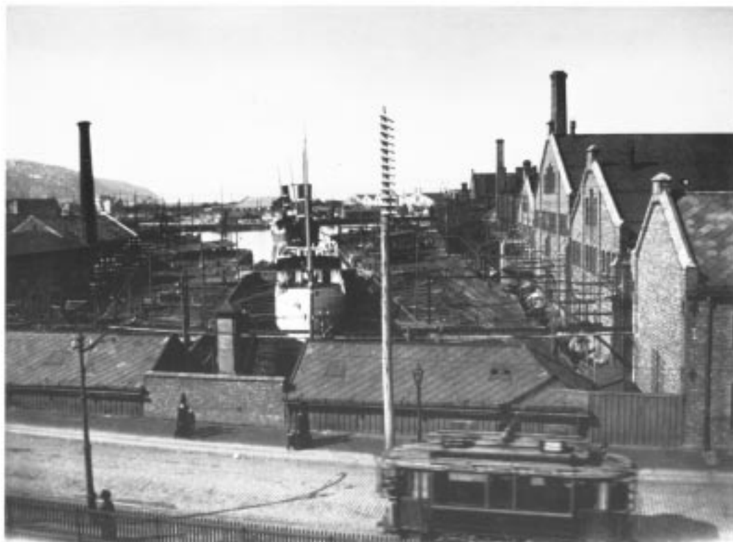
Trondhjems Mekaniske Værksted

Bilde fra TMV-tomta før og nå. Må vel si at dette er store kontraster