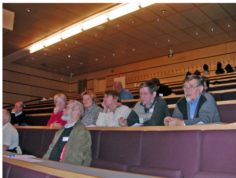
Personvern var hovedtema for slektsforskerdagen i Tromsø i 2005.